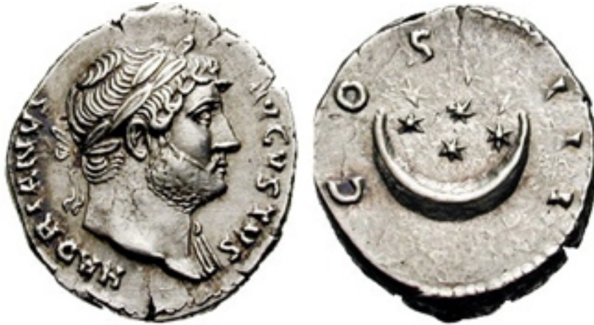
Coin of Roman Emperor Hadrian