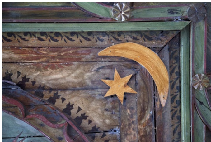
Crescent moon and star are among the decorations on the ceiling of a room in the tekke of Blagaj

...And also you turned to the idols and went after the Baalim when you entered yesterday into their "holy places" and I have already informed you that seven clouds of glory escort you and all of them separated from you when you entered into there and they wanted to depart from you entirely if not for those of the yeshiva above that prayed for you that they not depart from you and by means of this prayer the seven clouds of glory waited for you until you left (the Tekke temple).