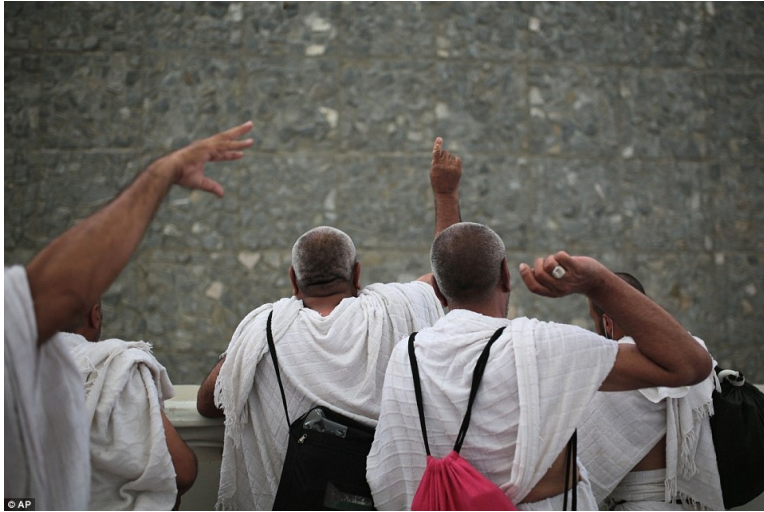
Throwing rocks at the wall today in their seamless garments at the Hajj